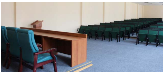
Sala de conferință