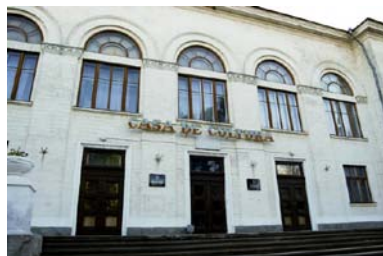
Casa de Cultură