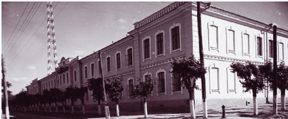
Blocul de studii nr. 2. al Universității de Stat din Moldova la sfârșitul anilor '50 ai sec. XX

Înființată în anul 1959, la ceva mai mult de un deceniu de la fondarea USM, Facultatea de Drept este una dintre cele mai vechi și mai prestigioase facultăți ale Universității de Stat din Moldova. Este o adevărată pepinieră de cadre juridice pentru Republica Moldova și autoritățile ei publice; or, majoritatea judecătorilor, procurorilor, avocaților, notarilor, executorilor judecătorești sunt absolvenți ai Facultății de Drept a USM.