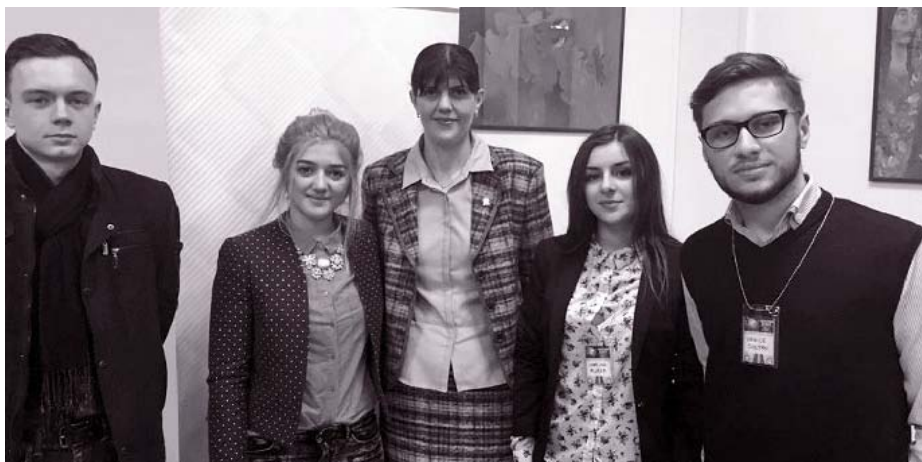
Studenți din RM, într-o vizită de studiu la DNA, București, 2016

Asociația Publică „Clinica Juridică” , creată în scopul eficientizării procesului de învățământ, constituie o alternativă inedită și eficientă pentru soluționarea problemelor cu care se confruntă sistemul de învățământ juridic, asigurând studenților oportunități inedite de consolidare a cunoștințelor teoretice obținute prin utilizarea metodelor creative, interactive, pe de o parte, iar, pe de altă parte, posibilitatea aplicării practice a cunoștințelor prin oferirea asistenței juridice gratuite, care implică soluționarea cazurilor reale, întocmirea actelor procesuale, evoluarea în instanțele de judecată. Astfel, anual în cadrul Clinicii sunt instruiți aproximativ 30 de studenți, circa 100 de persoane beneficiază de asistență juridică gratuită, fiind reprezentate, în cazurile necesare, în instanțele de judecată.