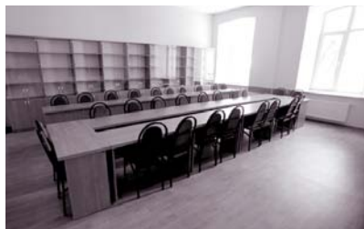
Sală de curs